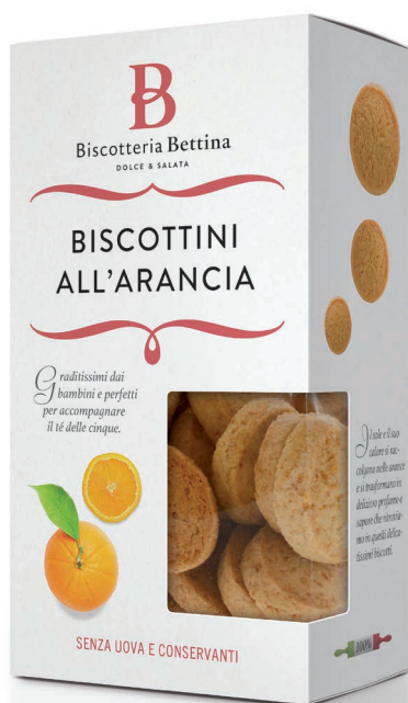
Astuccio / Box 170g