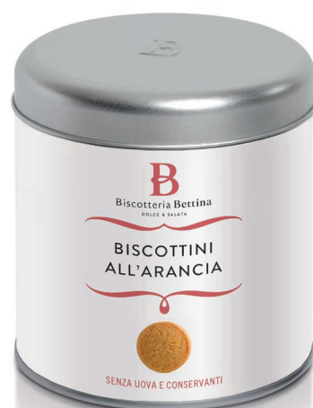
Barattolo / Tin 200g

BISCOTTI ALL'ARANCIA. Ingredienti: farina di frumento , burro ( latte ), zucchero di canna, arancia candita (scorza d'arancia, sciroppo di glucosio, zucchero) 12%, latte , olio essenziale di arancia, sale, agenti lievitanti: cremore di tartaro, bicarbonato di sodio e carbonato di calcio (0,2%). ORANGE BISCUITS. Ingredients: wheat flour, butter ( milk ), cane sugar, candied orange peel (orange peel, glucose syrupe, sugar) 12%, milk , orange oil, salt, Raising agent: cream of tartar, sodium bicarbonate and calcium carbonate (0,2%).