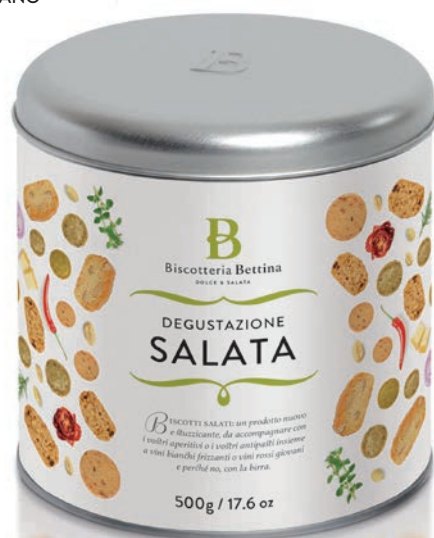
Barattolo / Tin 500g